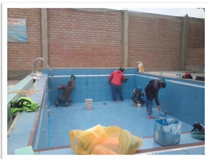
Piscina La Casa del Algodón en