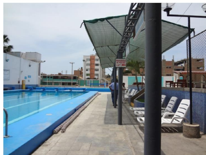
Piscina Club Tennis Huacho