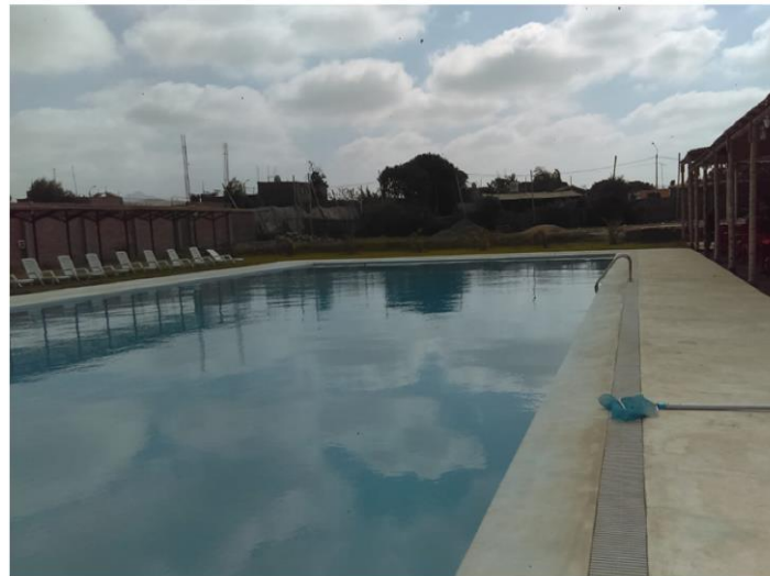
Piscina Paraíso de Bona