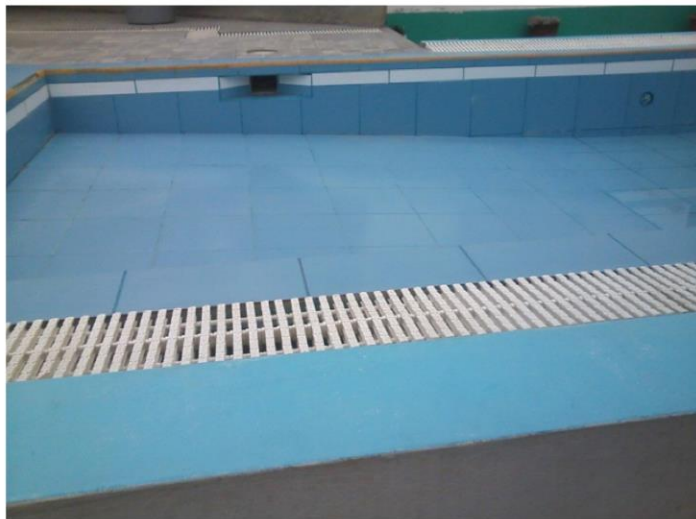
Pliscina Hotel Centenario