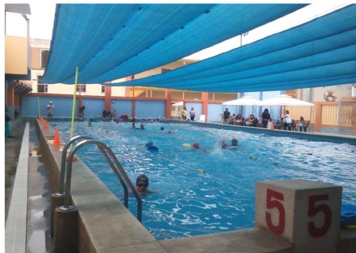
Piscina Ilos Delfines (Mantenimiento)