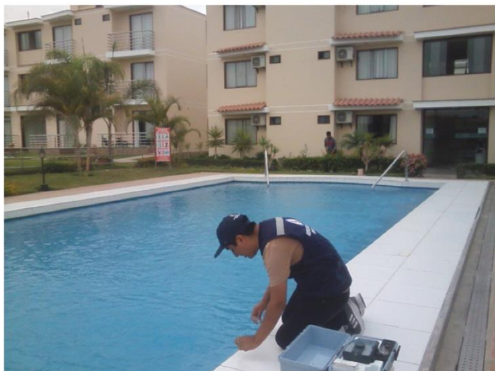
Piscina Hotel Pacifico en mantenimiento