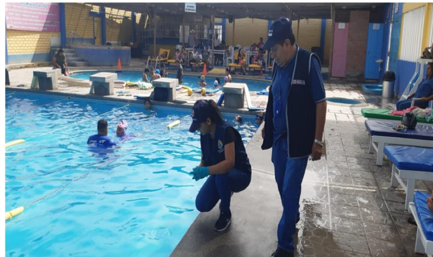
Piscina Club Tennis Huacho