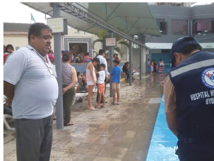
Piscina Ilos Delfines (Mantenimiento)