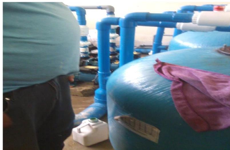
Piscina Club Tennis Huacho