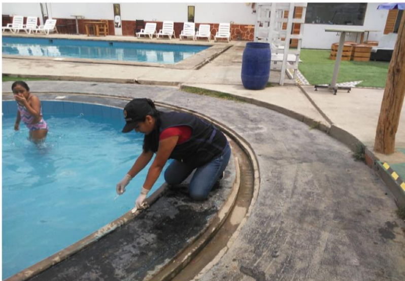
Piscina Mundo Mágico