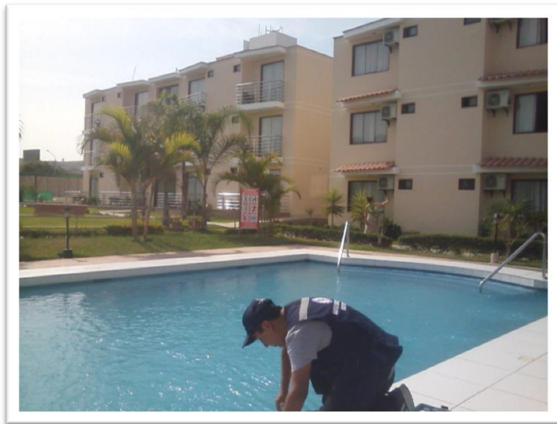
Hotel Sol y Palmeras