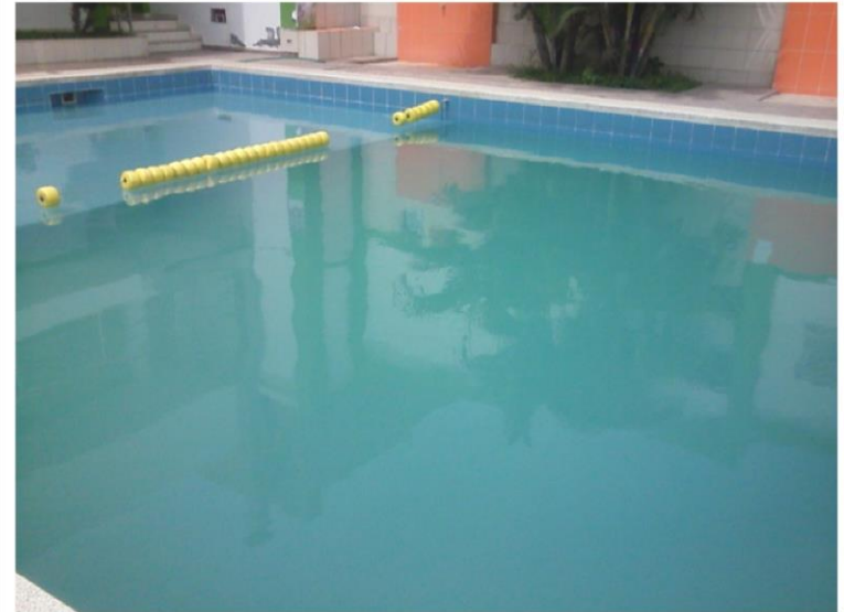
Piscina- Los Delfines