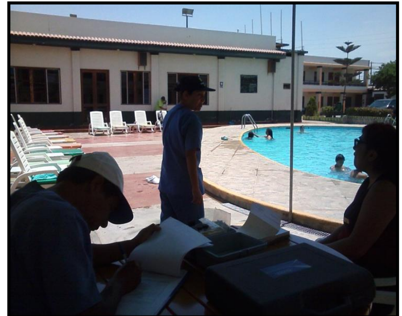
Hotel La Villa