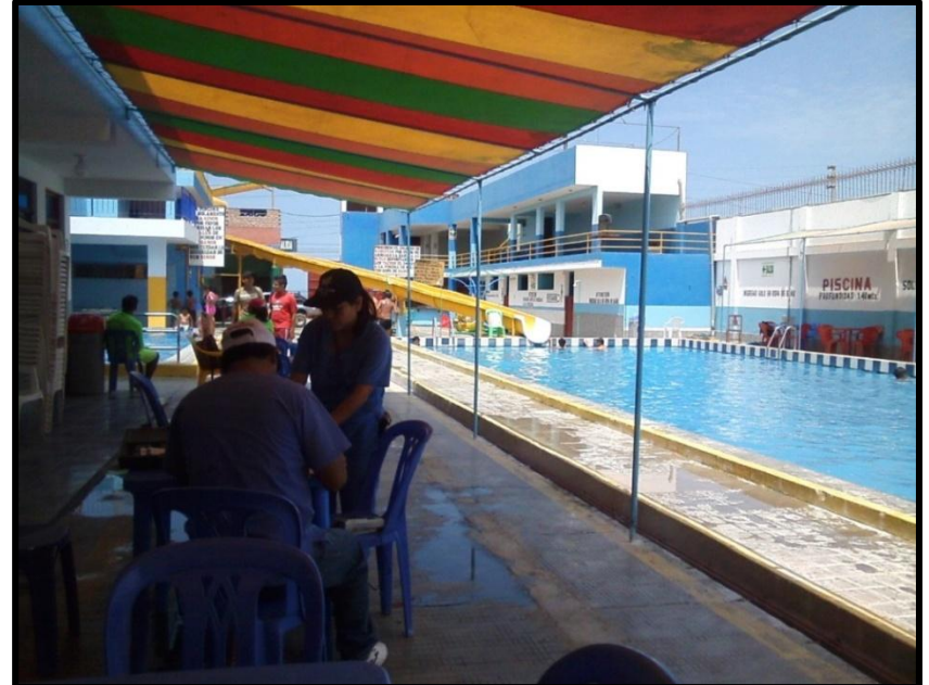
Hotel Paraíso del Norte