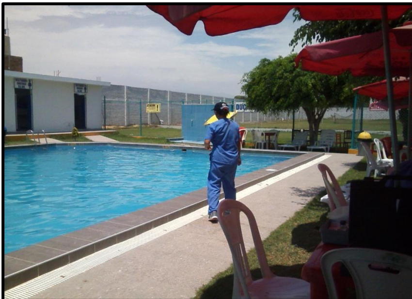
Piscina Restaurant Chinchay