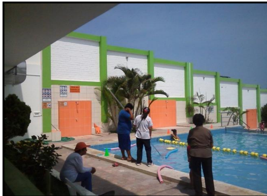
Villa Deportiva Los Defines