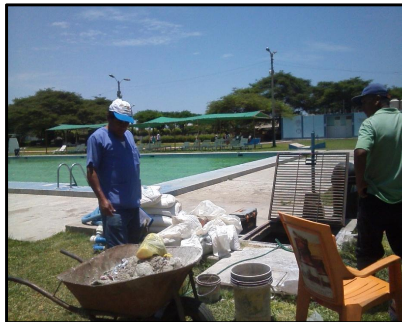
Club Tennis- Sede Campestre