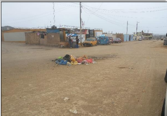
Calle Los Sauces / Av. Los Proceres.