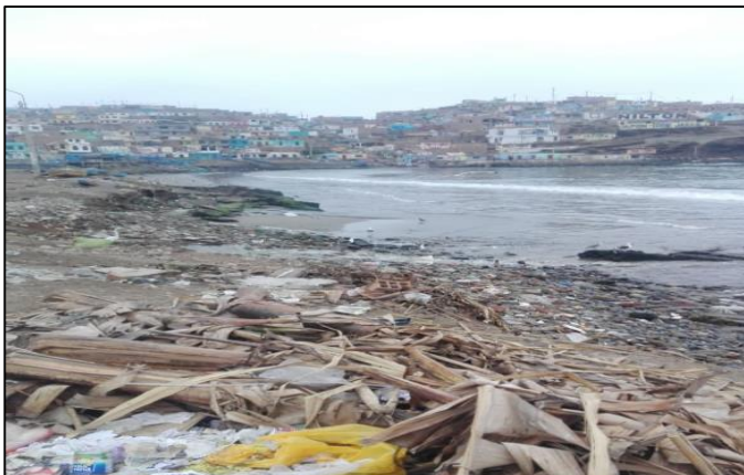
Pasaje José Olaya/ San Martín, frente a la playa