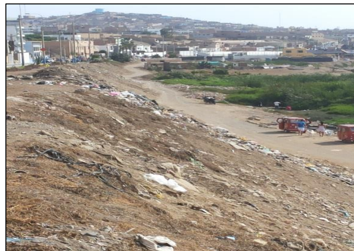
Calle Luna Arrieta