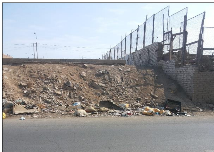
Salaverry frente a losa de futbol