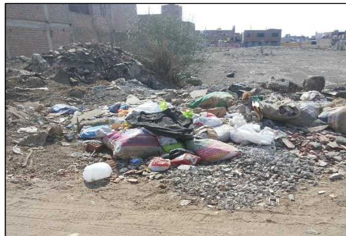
Av. La paz cuadra 6