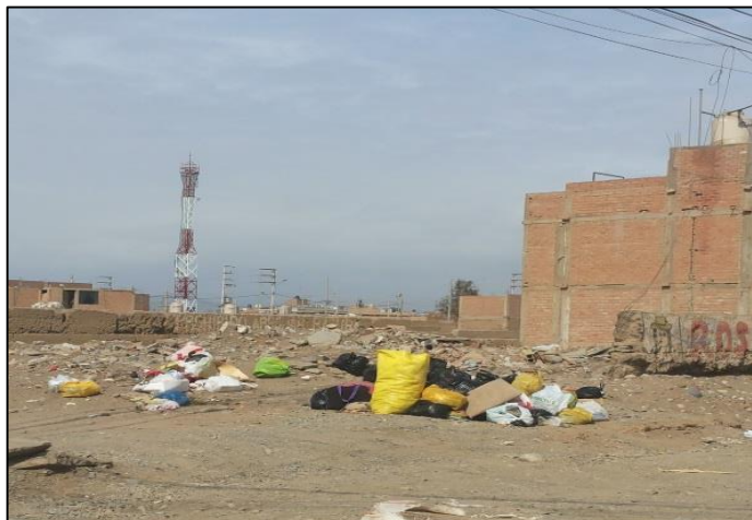
Ausejo Pintado frente It 3