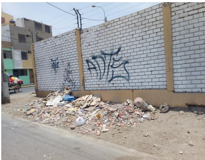
Av. Moore/Calle Libertad