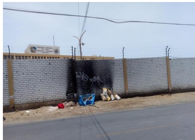
Calle Libertad, espalda del Hospital Regional de Huacho