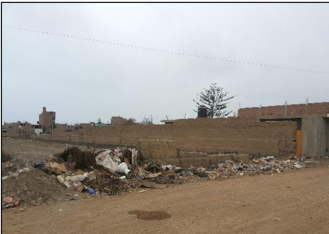
Av. La Paz Cdra. 7 - Amay