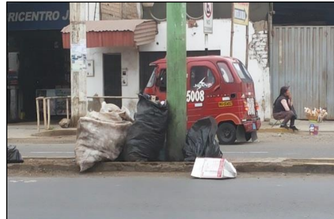
Antigua Panamericana Norte Frente al Terminal Terrestre.