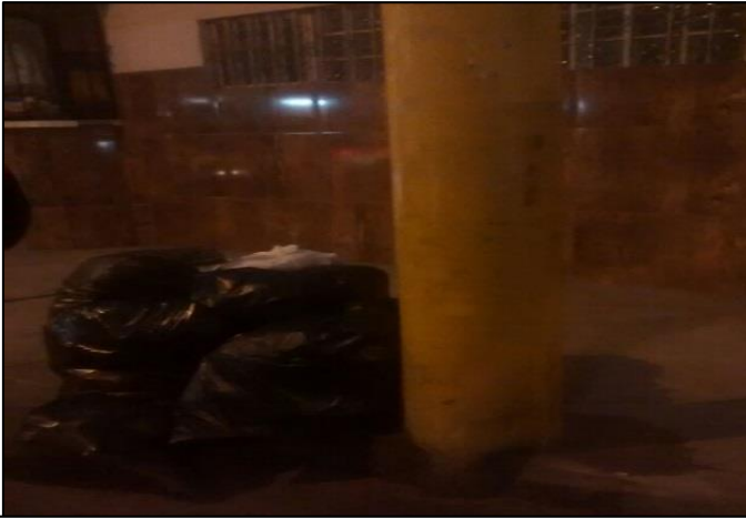
La Paz Cdra 2 - Amay