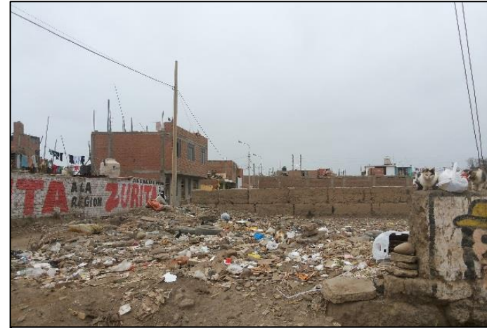
Calle. Ausejo Pintado Frente al Lote 3