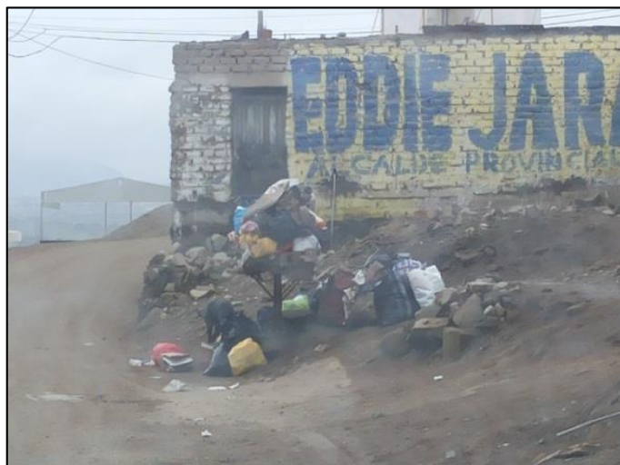
Calle Los Pescadores / Calle Bolognesi