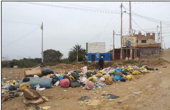
la Nueva Panamericana Norte y calle Félix B. Cárdenas