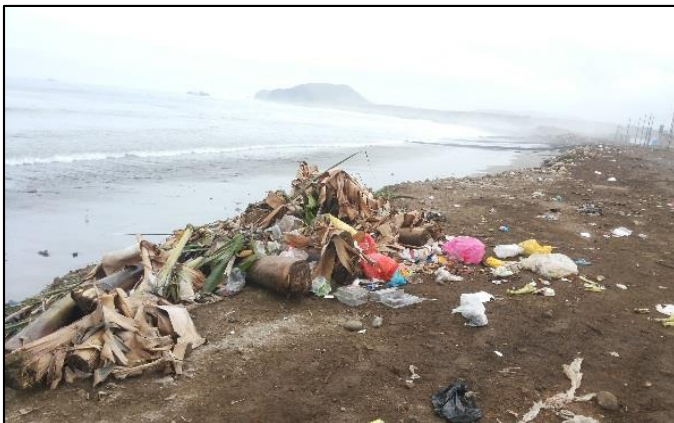
Pasaje José Olaya/ San Martín, frente a la playa