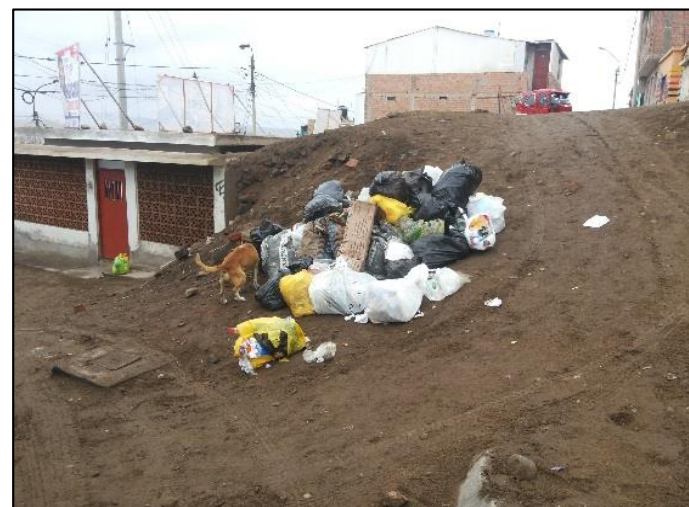
Av. Industrial, altura de la fábrica