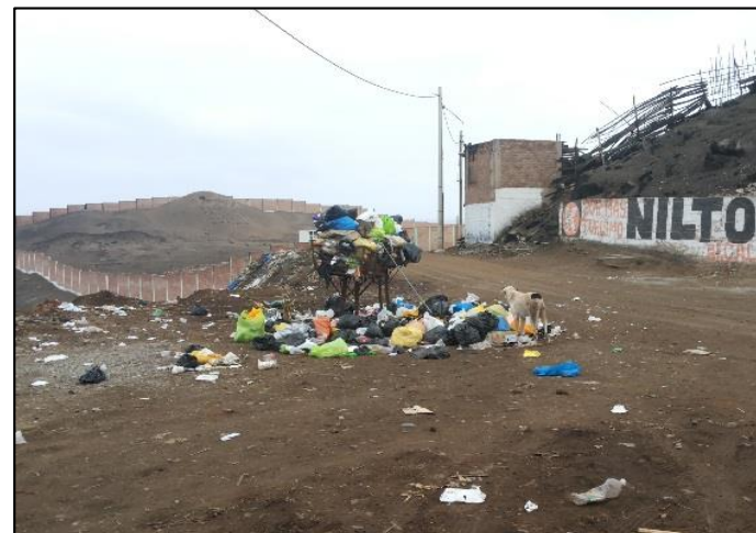
Calle Los Pescadores / Calle Bolognesi