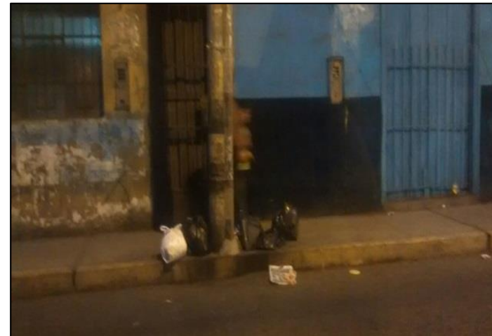
Calle Mariscal Castilla