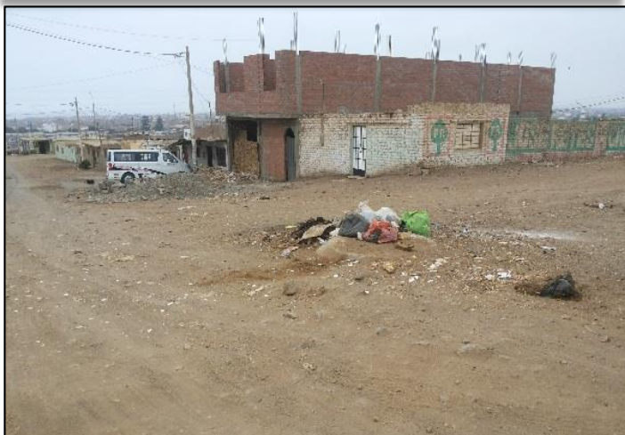
Los Pinos Frente Mz. J Lt. 3