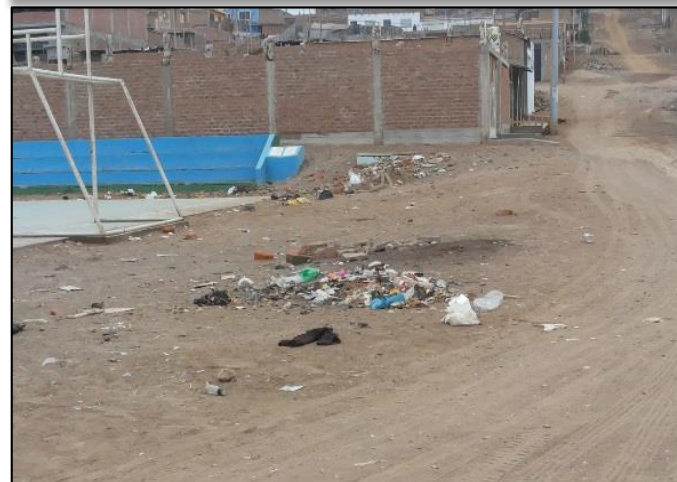
Av. San Antonio – loza deportiva