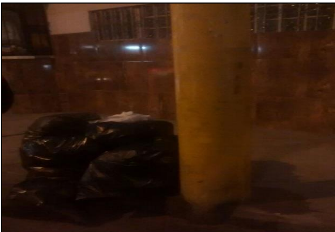
La Paz Cdra 2 - Amay