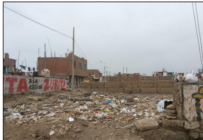
Calle. Ausejo Pintado Frente al Lote 3