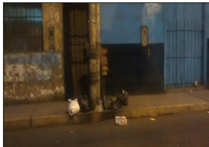
Calle Mariscal Castilla