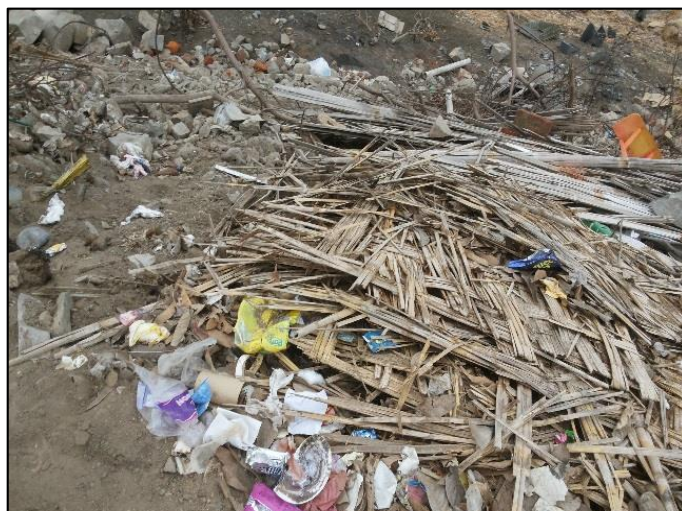
Calle Los Pescadores / Calle Bolognesi