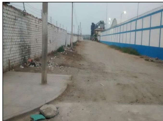
Av. Industrial, altura de la fábrica