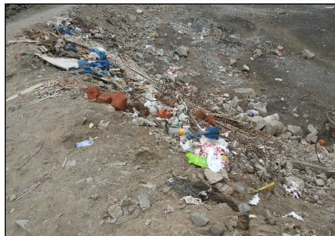
Calle Los Pescadores / Calle Bolognesi