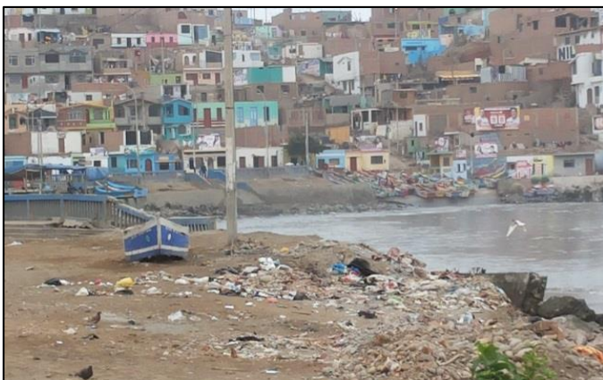
Pasaje José Olaya/ San Martín, frente a la playa