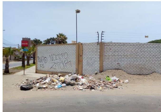
AV. Baltazar La Rosa/Av. Moore