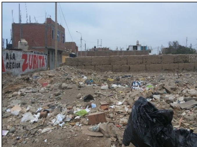
Calle. Ausejo Pintado Frente al Lt 3