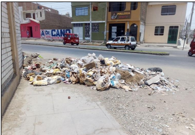
AV. Baltazar La Rosa/Av. Moore