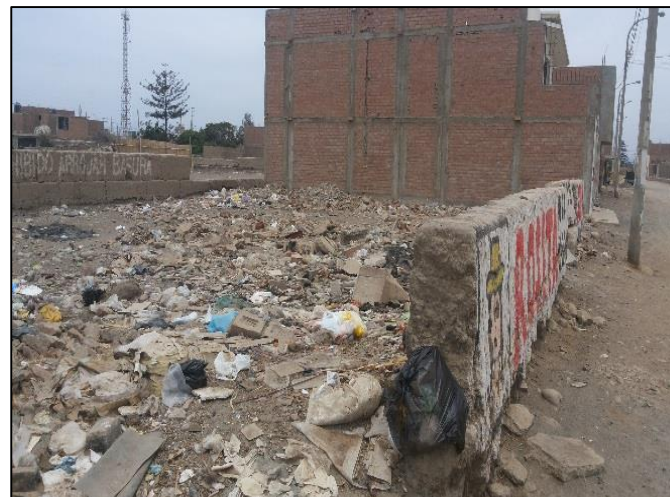
Calle. Ausejo Pintado Frente al Lt 3