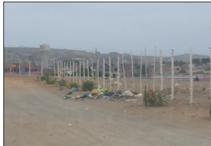
Calle Auxiliar Frente a los Cipreses