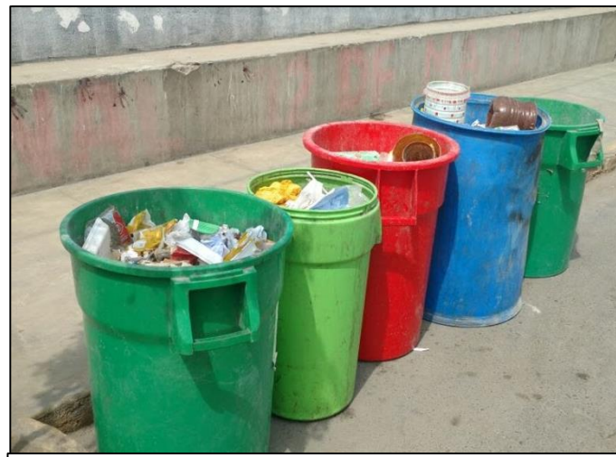
Av. San Francisco s/n - Huaura