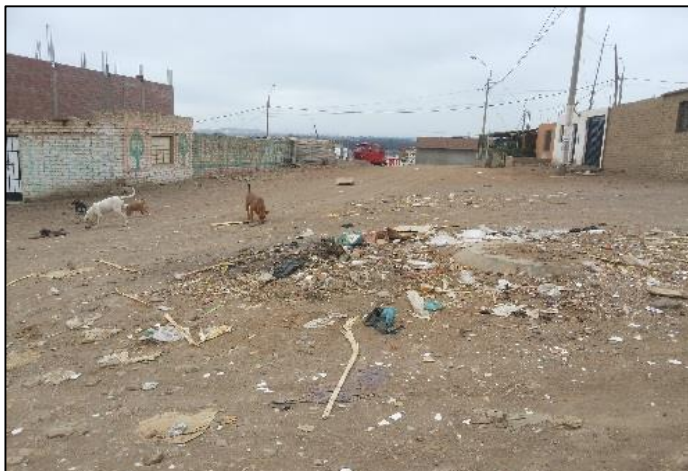
Los Pinos J-3