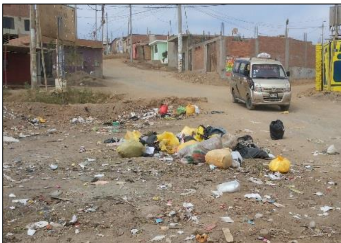
Los Pinos / Av. Felix B. Cardenas