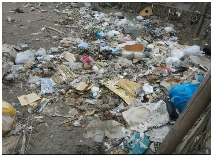
Psj. Los Olivos - Amay