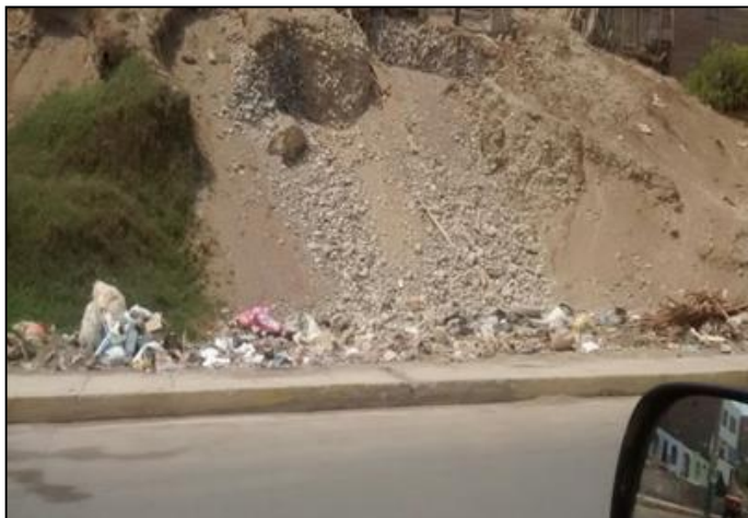
Calle Luna Arrieta - Huacho