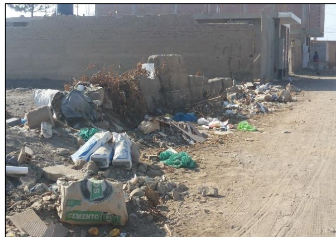
La paz cuadra 6 - Huacho