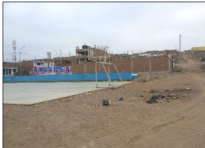
Av. San Antonio - Losa