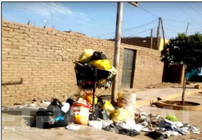
Socorro - Huaura