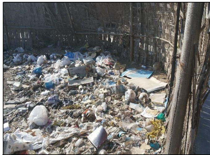
Ausejo Pintado frente It3