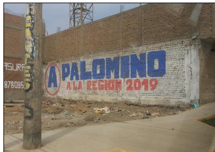
Calle Salaverry / Calle La Paz