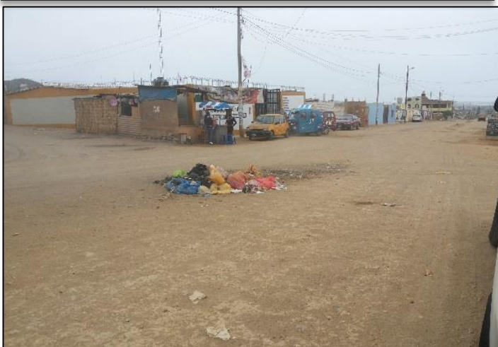
Calle Los Sauces / Av. Los Proceres.