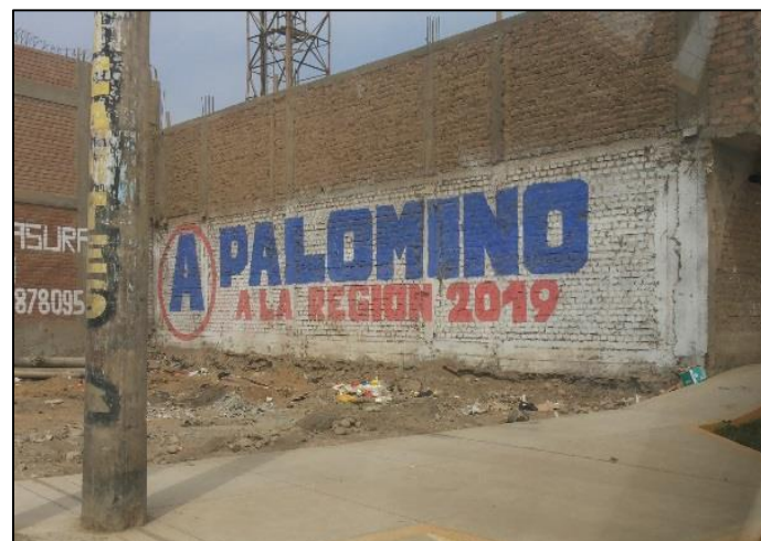
Calle Salaverry / Calle La Paz