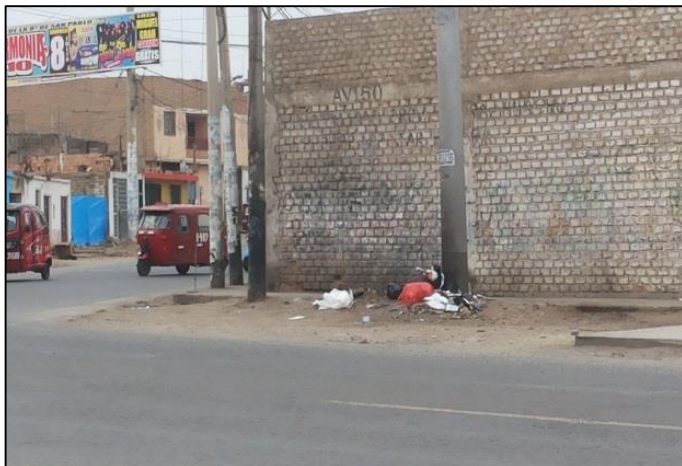
Calle Bellavista / Av. Cincuentenario