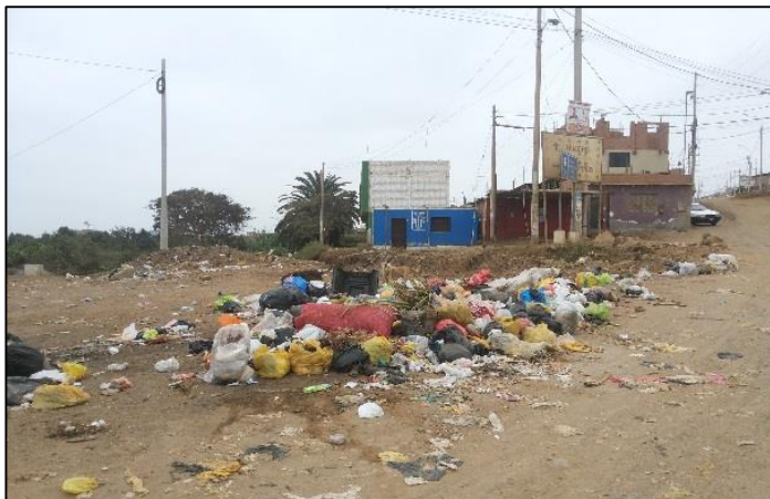
Ingreso a Los Pinos altura de la Nueva Panamericana Norte