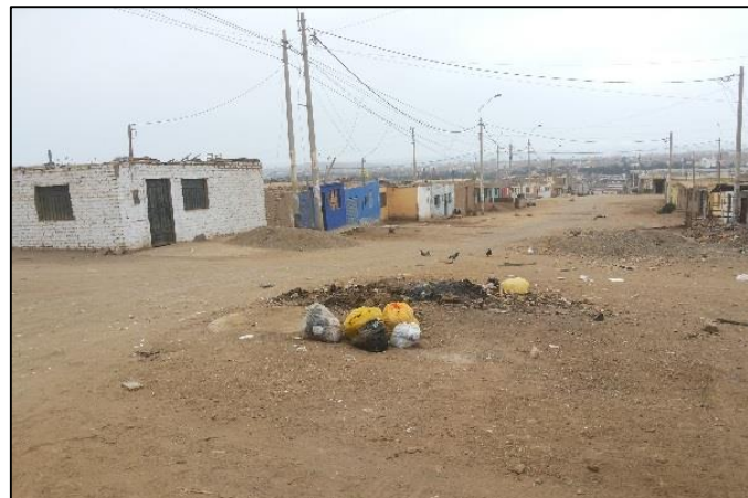
Los Pinos Frente Mz. J Lt. 3