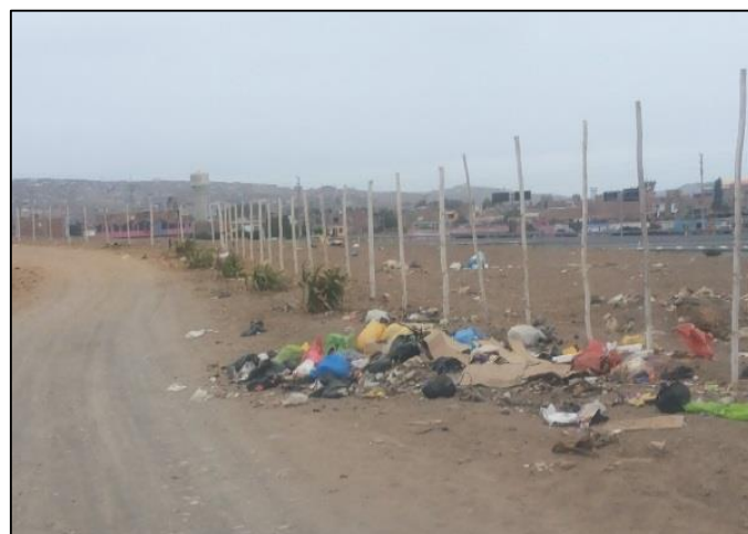
Prolong. Félix Cárdenas- Los Pinos.