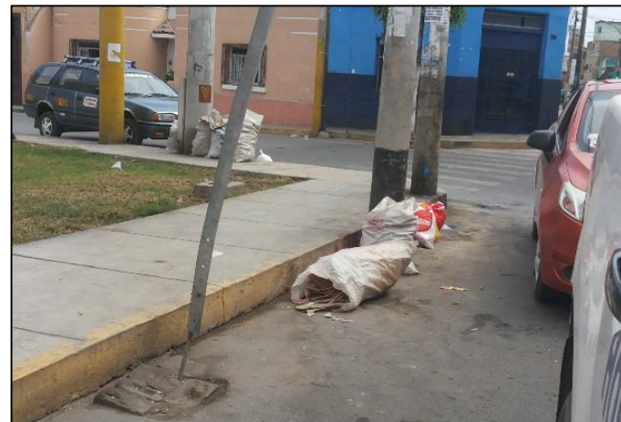
Calle. Leoncio Prado / calle Alfonso Ugarte.