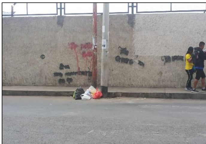
Calle Leoncio Prado / Calle Ausejo Salas